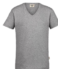
015 grau meliert