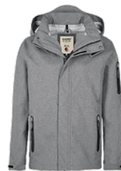
315 dunkelgrau meliert