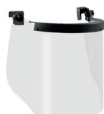
WV100014 ARC VISOR CLASS 1