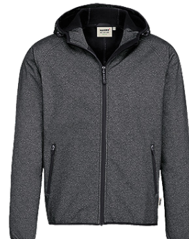
328 anthrazit meliert