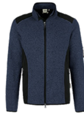
329 marine meliert