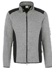
015 grau meliert