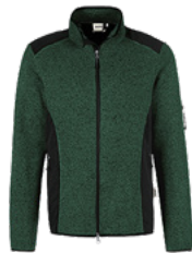
372 tanne meliert