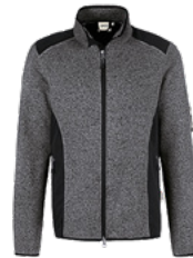
328 anthrazit meliert