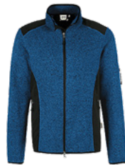
310 royalblau meliert