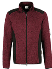
317 weinrot meliert