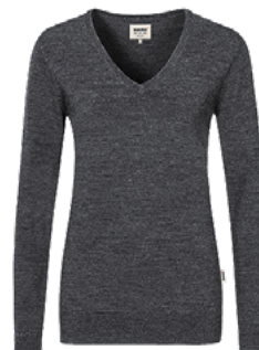
328 anthrazit meliert