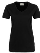
405 hp schwarz