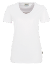
401 hp weiß

Ursprungsland Laos Zolltarifnummer 6109 9020 Datenblatt Stand: 11/2023