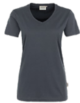
428 hp anthrazit