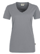
443 hp titan