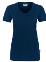
434 hp tinte