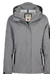
315 dunkelgrau meliert