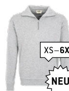
024 ash meliert