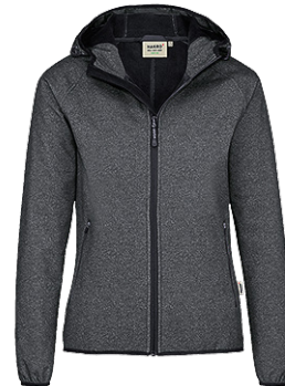
328 anthrazit meliert