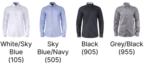
White/Sky Blue (105)